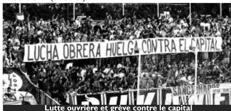
Lutte ouvrière et grève contre le capital

petits clubs promis par les villes aux fonds spéculatifs (les mêmes qui ferment les usines), d'autres montent des équipes directement liées à la CNT (en Galice).