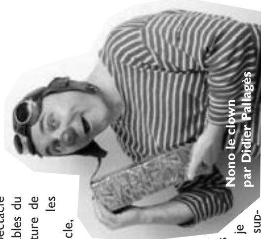
Nono le clown par Didier Pallagès