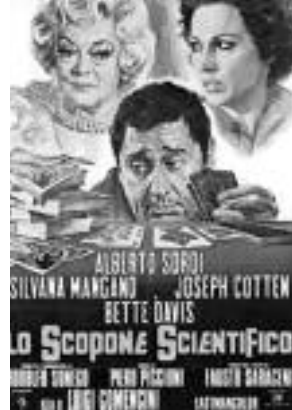
L'Argent de la Vieille Luigi Comencini, 1972

À l'occasion de la cérémonie des Césars, les salariés des cinémas Gaumont Pathé ont tenu à rappeler à cette même presse, peu encline à relayer leur mouvement, que dans peu de temps, il n'y aura plus de projectionnistes dans les cinémas.