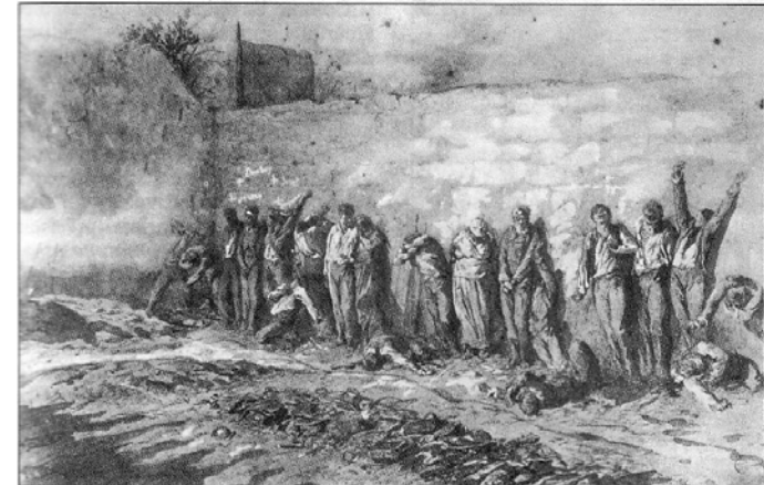
Fusillade de Communards

« Ils [les prolétaires réunis ce jour-là dans les meetings] discutent l'enseignement qu'il faut tirer de la Commune de 1871 pour la prochaine révolution ; ils se demandent quelles étaient les fautes de la Commune, et cela non pour critiquer les hommes, mais pour faire ressortir comment les préjugés sur la propriété et l'autorité qui régnaient en ce moment au sein des organisations prolétariennes, ont empêché l'idée révolutionnaire d'éclorre, de se développer et d'éclairer le monde entier de ses